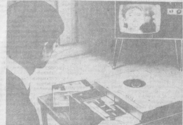
Цветной «видеооскоп» — одна из последних работ японской фирмы «Сони», известной своими новинками в области радиотехники. Этот аппарат позволяет воспроизводить видеозаписи на экране телевизора. На магнитную ленту можно записывать черно-белые и цветные программы.