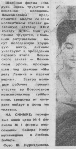
Швейная фирма «Юлдаз». Здесь трудится в основном молодежь. Комсомольцы предприятия вместе со всем коллективом готовят достойную встречу XXIV съезду КПСС. Они успешно трудятся с большим энтузиазмом несут молодежную трудовую вахту, активно участвуют в проведении первого этапа Ленинского зачета — Ленинском уроке, проводящем под девизом «Мы делу Ленина и партии верны». Завтра молодые рабочие примут участие во Всесоюзном комсомольском субботнике, средства от которого пойдут в фонд пятилетки.

Сегодня заканчивается первый этап Ленинского зачета, посвященного XXIV съезду КПСС. На нашем заводе в этот день по всем цехам пройдут