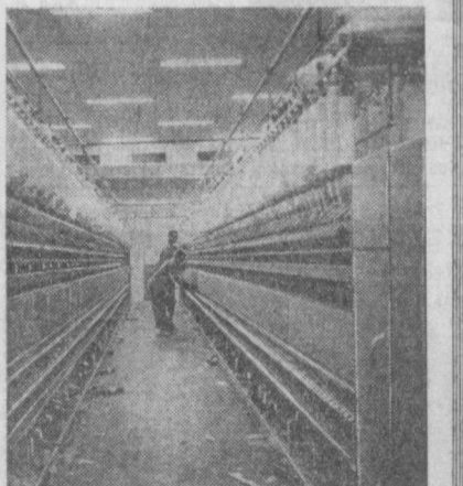
Текстильный комбинат в Банги — крупнейшее промышленное предприятие Центральноафрикан- ской Республики. Он выпускает в год около 6 миллионов метров различных тканей из местного хлопка, обеспечивая потребности страны в хлоп- чобумажных тканях. НА СНИМКЕ: в преддверии цеха текстильного комбината.

РАСИСТСКАЯ политика властей Южно- Африканской Республики наглядно про- является в области образования. По сообще- нию английской газеты «Файнвилл таймс», правительство ЮАР расходует ежегодно на обучение каждого африканского школьника менее 15 рандов, в то время как на обучение белого — 228 рандов. Нищенская зарплата учителей в школах для африканцев ведет к острой нехватке преподавателей. Малое число школьных помещений и недостаток учителя, платное обучение — все это является причи- ной того, что лишь незначительная часть африканских детей посещает школу. А из тех, кто поступает в школу, четвертая часть бро- сает ее, не получив даже начального образо- вания.