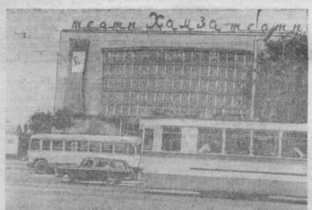
ТАШКЕНТ СЕГОДНЯ. НА СНИМКЕ: УЛИЦА НАВОИ. ВИД НА ТЕАТР ИМЕНИ ХАМЗЫ.