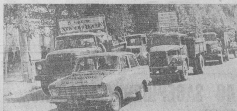
НА СНИМКЕ: машины с металломом, собранный комсомольцами Ленинского района во время субботника.

Более 15 тысяч фрунзенцев работали на хлопковых полях. В комсомольском субботнике участвовали юноши и девушки Ушанзарского, Хамзинского, Кировского, Октябрьского и Сергелинского районов города.