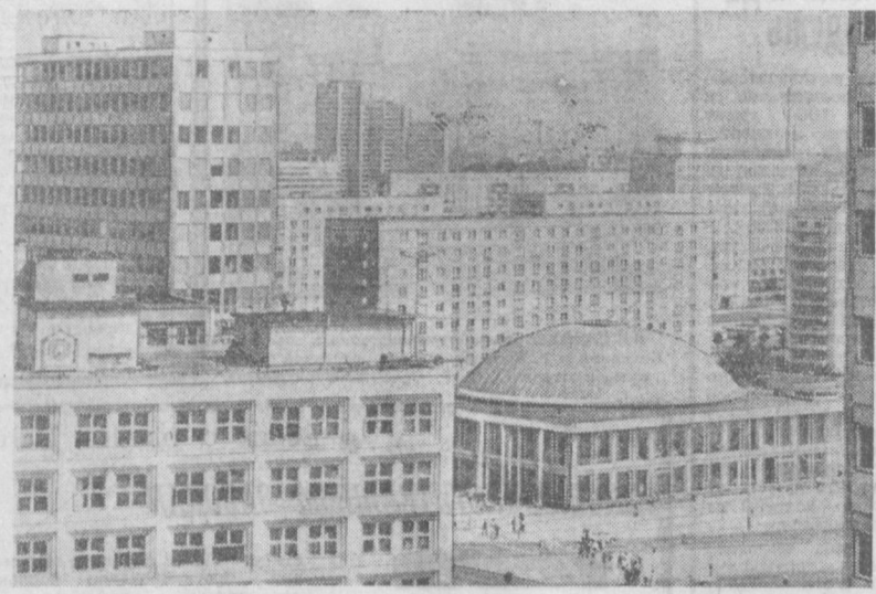
Совершенно новый облик центра Берлина с его красивыми многоэтажными домами убедительно свидетельствует о тех больших изменениях, которые произошли в столице ГДР за последние годы. В городе ведется большое жилищное строительство, сооружаются административные здания и культурно-бытовые учреждения.

говая делегация, его руко- водство, партийная и проф- союзная организации обе- щали выполнить заказ до ко- нца года. Развернувшись здесь социалистическое со- ревнование за досрочное из- готовление оборудования позволило отправить его в СССР значительно раньше установленного срока.