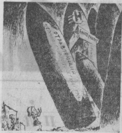
Наступление продолжается... (Рисунок из американской газеты «Дейли уорлд».)