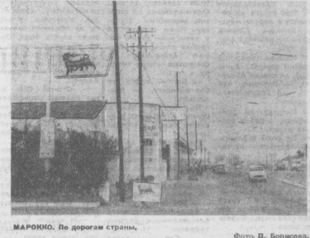
МАРРОККО. По дорогам страны.

В ходе занятий наряду с изучением русского языка слушатели знакомятся с русской и советской литературой и искусством, принимают участие в работе хорового и танцевального кружков, организованных при советском культурном центре.