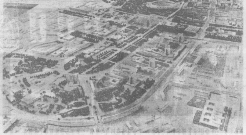
Тамни будет в недалеком будущем центр Ташкента. НА СНИМКЕ: манет части центра города, созданный коллективом института «Ташгипрогор».