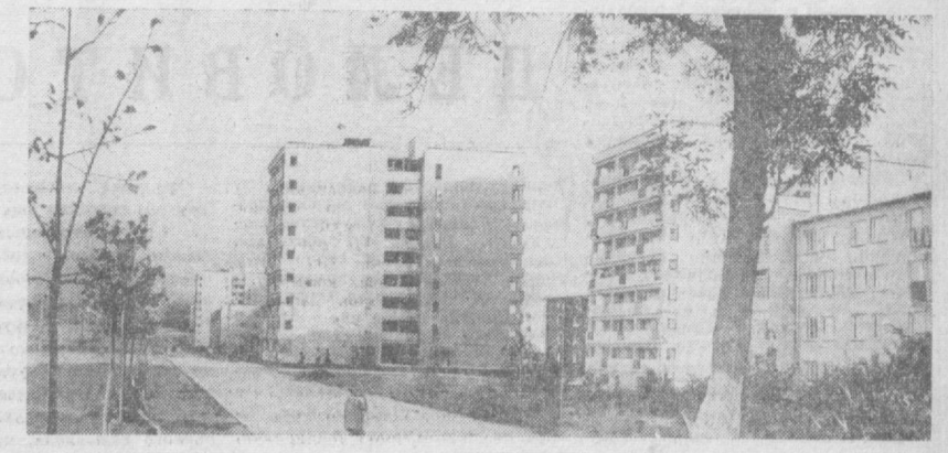
ТАШКЕНТ СЕГОДНЯ. НА СНИМКЕ: новые жилые дома в квартале Ц-4.