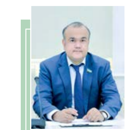
Нодир ЖУМАЕВ, Олий Мажлис Қонунчилик палатаси қўмита раиси

Марказий Осиё давлатлари етакчилари ва Европа Иттифоқининг асосий институтлари раҳбарлари Самарқанд халқаро иқлим форумининг ялпи мажлисида ҳам иштирок этади. Демак, халқаро анжуман бу фақат саммит билан боғлиқ эмас, балки Европа Иттифоқи ва Марказий Осиё ўртасидаги боғлиқликни янада мустаҳкамлаш ва чуқур тарихий илдизлар, умумий манфаатлар ва яқин ҳамкорликка объектив интилиш билан чамбарчас боғлиқ. Саммитнинг формати ноёб экани билан муҳим аҳамият касб этади. Яъни иқтисодиёт ва инвестициялар, барқарор ривожланиш, хавфсизлик ва рақамли трансформация муҳокама марказида бўлади.