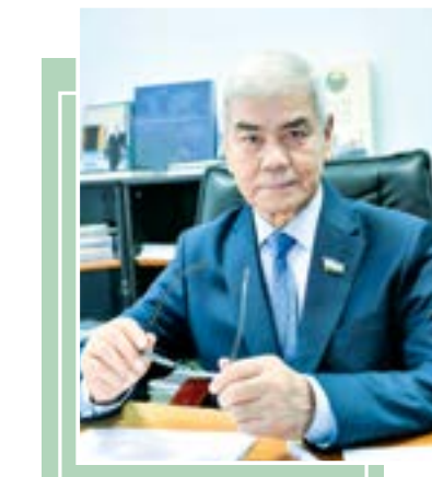
Абдусайд КҶЧИМОВ, Олий Мажлис Сенати аъзоси

Ассамблея бу йил айни мавзуга муножрат қилмоқда. Зеро, парламентларга энди фақат қонун қабул қилувчи эмас, балки ижтимоий ўзгаришларни амалга ошириш, камбағалликни қисқартириш, тенг