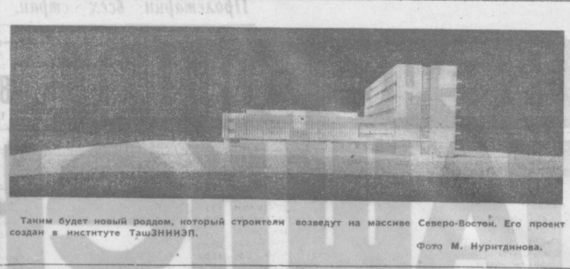
Такого будет новый роддом, который строители возведут на массиве Северо-Восток. Его проект создан в институте ТашЗНИИЭП.

Раиком партии обобщил эти мероприятия и взял их выполнение под свой контроль.