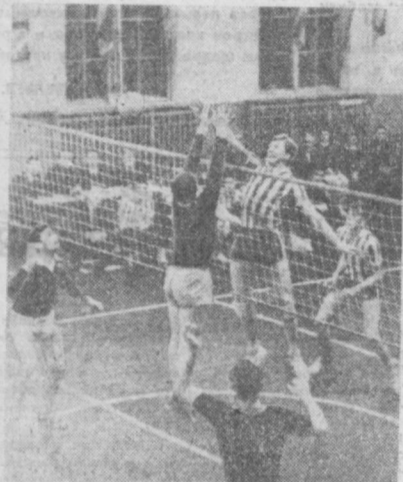
Поединок под сетью...