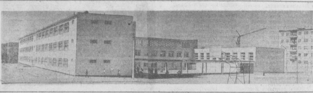
ТАШКЕНТ СЕГОДНЯ. НА СНИМКЕ: новая школа № 49, возведенная на массиве Высокопольный.