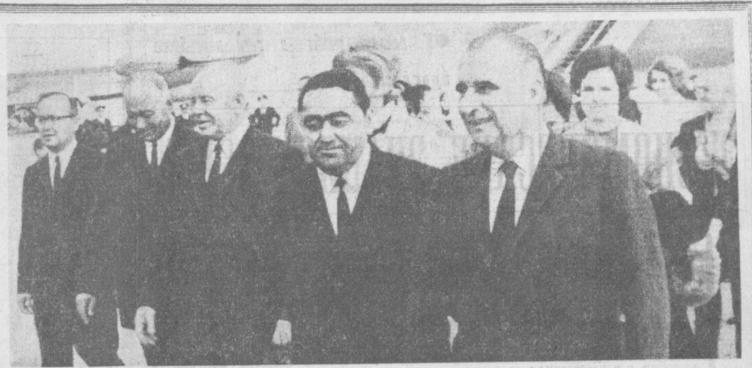
Ташкент. 10 октября 1970 года. Встреча в аэропорту.

Киноаппаратуру смонтировали монтажники бригады Е. Ушакова, представители завода «Узбекинодеталь». Кинотеатр — хороший подарок зрителям окраинного микрорайона.