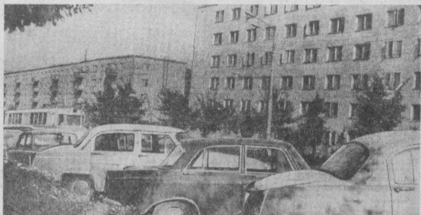
ТАШКЕНТ СЕГОДНЯ. На улице Навои.

Возглавляют клуб инструктор, культурно-массовые работы клуба «Коммуналистик» А. Пригожин и его заместитель, общественный инструктор Т. Мазина.