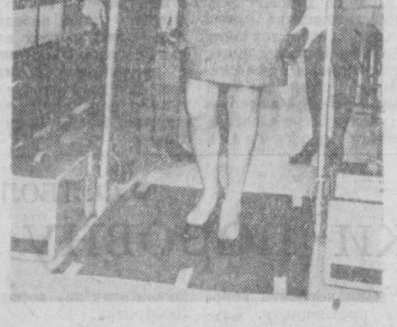
Одна из французских фирм предложила систему мер по обнаруживанию у пассажиров оружия. Специальный автомат фиксирует наличие металлических предметов у всех проходящих через это приспособление.

Сейчас стало более очевидным, чем когда бы то ни было, подтверждает «Юэ Ньюс», что американский народ не может поведать себе вести войны ради сохранения в власти продажной клики в Сайгоне. Продолжение войны стало нетерпимым для американского народа, и Соединенным Штатам следует выйти из нее. К такому выводу приходит газета.