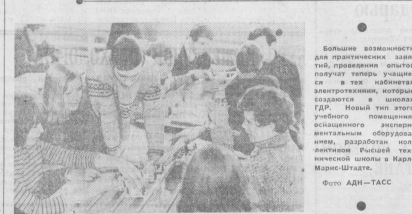
Большие возможности для практических занятий, проведения опытов получают теперь учащиеся в тех кабинетах элетротехники, которые создаются в школах ГДР. Новый тип этого учебного помещения, оснащенного экспериментальным оборудованием, разработан коллективом высшей технической школы в Карл-Маркс-Штаде.

чем в прошлом году. Урожай кукурузы в горных районах превзошел сбор прошлого года на целых 18 центнеров с гектара. Хорошие выходы на сбор бобовых в северных районах КНДР. Хлеборобы республики обещают завершить убороч-