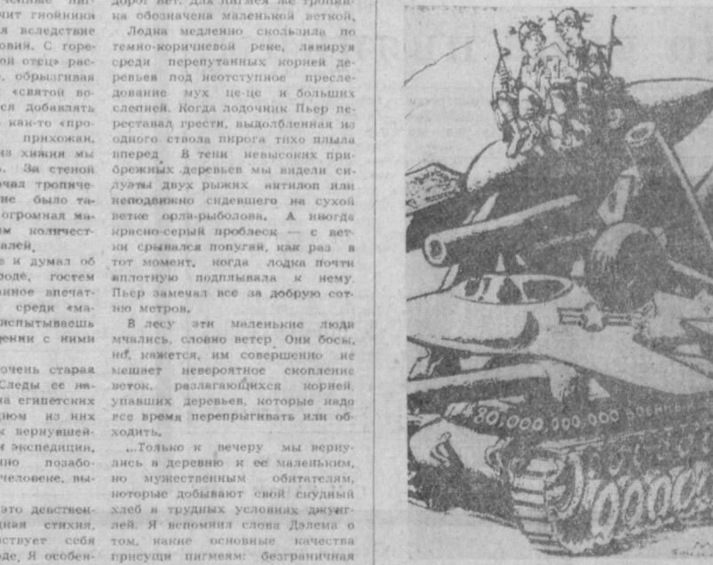
Один американский солдат другому: — Мой маленький братишка пишет из дома, что у них заканчивают школу из-за недостатка средств. Рисунок из американской газеты «Чингго сам таймс».

После ужина Далема из миссионера превращается в лекаря. Он