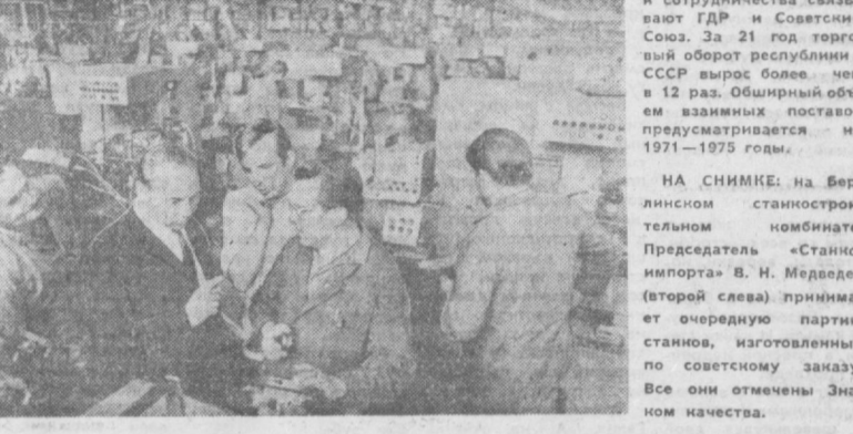
Узы большой дружбы и сотрудничества связывают ГДР и Советский Союз. За 21 год торговли между республиками СССР вывоз более чем в 12 раз. Обширный объем взаимных поставок предусматривается на 1971—1975 годы.

Продукция комбината, завоевавшего в социалистическом соревновании почетное звание предприятия имени 25-летия освобождения Чехословакии Советской Армией, широко известна не только в ЧССР, но и за границей. 37 стран мира покупают ткани, сделанные либерецкими текстильщиками.