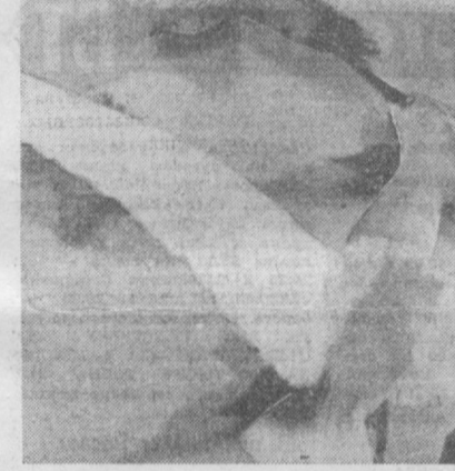
Процесс таксидермии животного мира Средней Азии: медведь, лиса, волк, шакал, косуля, архар, джейран, заяц, крошечные птицы — павлины, цапли, орлы, фазаны, совы и другие представители пернатого царства.