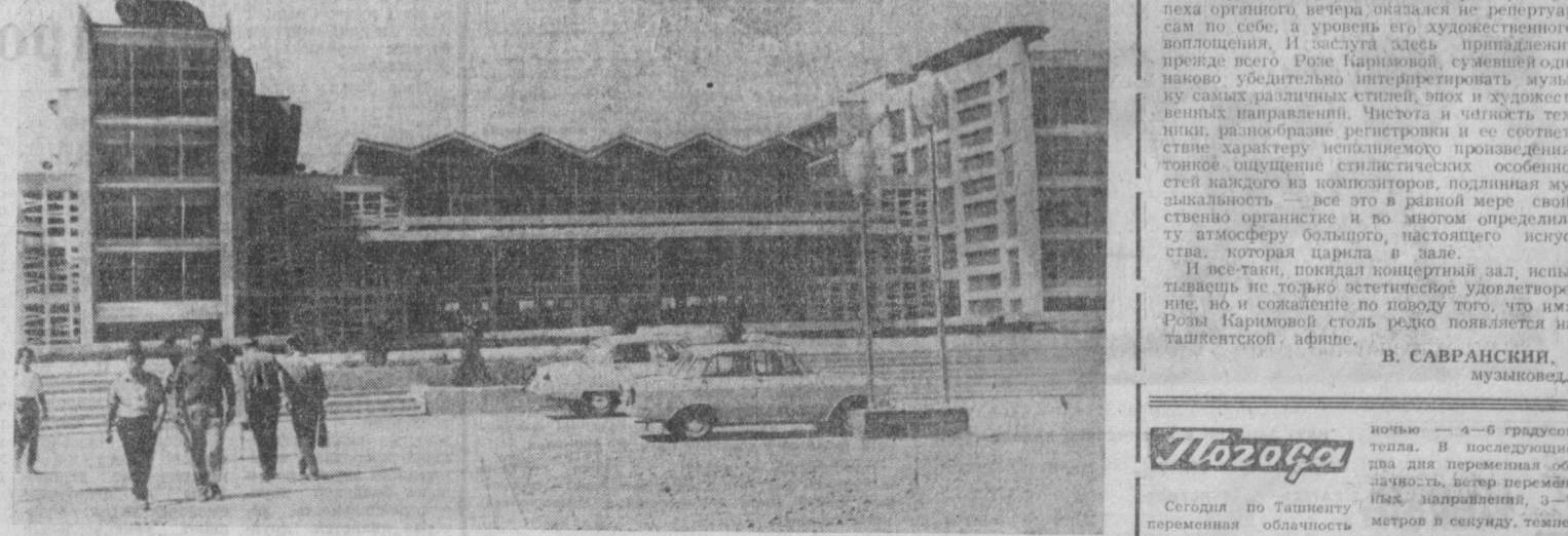
НА СНИМКЕ: один из корпусов Ташкентского государственного университета имени В. И. Ленина.

Красив студенческий городок! Но он станет еще красивее. Будет заложен памятник В. И. Ленину, по декрету которого был создан в 1920 году университет, юбилейный парк. Зеленью оденутся его проспекты, спортивные площадки. И по старой студенческой традиции будут здесь проходить унк-