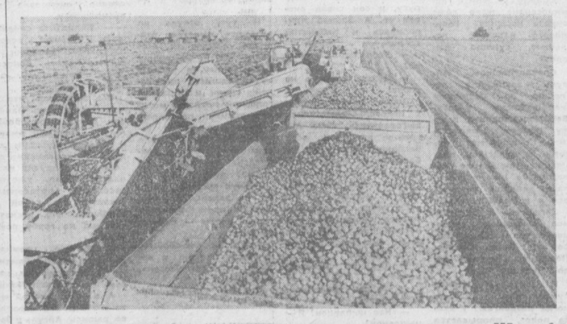
Современная сельскохозяйственная техника комплексно используется на полях ГДР для уборки урожая картофеля. По занимаемой площади эта культура стоит в республике на втором месте после зерновых. НА СНИМКЕ: картофелеуборочные комбайны в одном из кооперативов округа Галле.

Пятидесятый вуз — в Хунедаре, городе металлургов. Он будет готовить специалистов по десяти техническим специальностям. БУХАРЕСТ. В высших учебных заведениях республики начался новый учебный год. Свои двери открыли 49 университетов и институтов, как в прош-