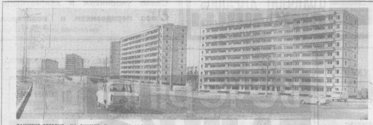
ТАШКЕНТ СЕГОДНЯ. НА СНИМКЕ: Проспект Дружбы народов.

В. ШЕВАНОВ, главный инженер мельницы № 3.