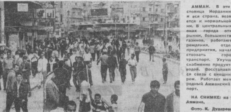
АММАН. В эти дни столица Иордании, как и вся страна, возвращается к нормальной жизни. В центральных районах города открыты рынки, большинство магазинов, работают учреждения, отдельные предприятия, начал действовать городской транспорт. Улучшилось снабжение продуктами и водой. Восстанавливается связь с внешним миром. Работает международный Амманский аэропорт. НА СНИМКЕ: на улице Аммана.