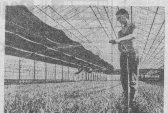
ВЕНГРИЯ. Новая оранжерея площадью в 45 тысяч квадратных метров построена в Будапеште близ венгерской столицы для Общества сельскохозяйственного кооператива. Выращиваемые здесь декоративные растения предназначаются главным образом для экспорта.

Большое внимание уделяется сейчас в стране подготовке медицинских кадров. Будущие врачи, фельдшеры, медсестры обучаются в хорошо оборудованных медико-фармацевтическом институте и специальных школах, а также в вузах Советского Союза и других социалистических стран.