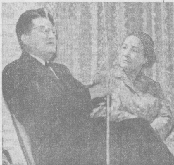
В Узбекском государственном музыкальном театре имени Муини недавно поставлена пьеса С. Абдуллы «Моя Жаннат».

Сердцу не любить тебя нельзя, Поколениям воспетый город. Дремлют башни, груз веков неся, Голубые арки с небом спорят. Слово слышу прадедов наказ: «Красотой бессмертной дорожите!» Свет твоих узоров не угас, Самарканд — великий должитель. Седины стравивший с головы, Радостно-счастливым, как влюбленный, Здравствуй, брат Ташкента и Москвы! Здравствуй, современник Вавилона! Огоньки на заводской трубе, Вечный пламень перед обелиском — Самарканд, нам дорого в тебе Все, что далеко, и все, что близко. Нет, не потерялся ты в веках И, как вся Страна Советов, молод. Потому, что у тебя в руках — Мирное оружие — серп и молот. Знаменит на трудовой страде И прославлен силой молодежкой, Самарканд — рабочий и студент, Как подросток Родины Советской. Празднично-бурлящая река И огней сверкающие грозды... С днем рождения, звездный Самарканд! С днем рождения, город краснозвездный!