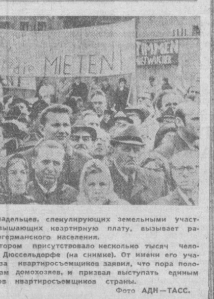
ФРГ. Производ домовладельцев, спекулирующих земельными участками и неправомерно повышающих квартирную плату, вызывает большой протест западногерманского населения. Большой митинг, на котором присутствовало несколько тысяч человек, состоялся недавно в Дюссельдорфе (на снимке). От имени его участников председатель Союза квартиросъемщиков заявил, что пора положить конец издевательствам домохозяев, и призвал выступать единым фронтом все 40 миллионов квартиросъемщиков страны.

НА ДНЯХ итальянская печать сообщила, что канцелярия архиепископа Генуи с помощью духовных настоятелей собирает сведения об образе мыслей учителей и школьников в двухстах учебных заведениях города. Чтобы удобнее было следить за умонастроениями учащейся молодежи, создана специальная картотека, в которой уже насчитывается более пятидесяти тысяч личных карточек. Постыдные обязанности, возложенные на проповедников «закона божьего» в итальянских школах, стали известны общественности благодаря смелым разоблачениям «напорного монаха» францисканца Агостино Дзербинати, которому совет не позволило доносить на доверчивых ему людей, «богопротивное» поведение брата Агостино вывело бурю негодования со стороны должностных лиц католической церкви. Тек, директор католического управления епархии монсеньор Стефано Патроне обвинил азбутовашающего священнослужителя в сознательном нарушении «нормального порядка» общения с паствой. Дзербинати предположил, что его лишить возможности читать проповеди, если он не прекратит возмущать общественное спокойствие своими выступлениями. В чем же состоит «нормальный» — по утверждению монсеньора Патроне — порядок общения с паствой? Монсеньор не видит ничего предосудительного в том, что одновременно с толкованием текста евангелия ду-