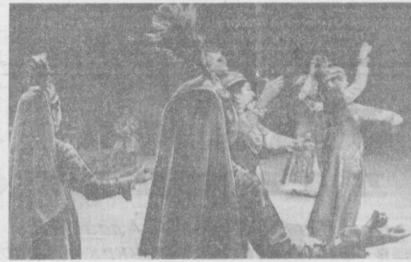
НА СНИМКЕ: хивинский танец исполняет ансамбль песни и танца Узгосфилармонии имени М. Карьякубова.

В прениях по докладу выступили также заместитель прокурора города В. Я. Егоров, прокурор Хамзинского района А. Хаджиханов и другие работники прокуратуры.