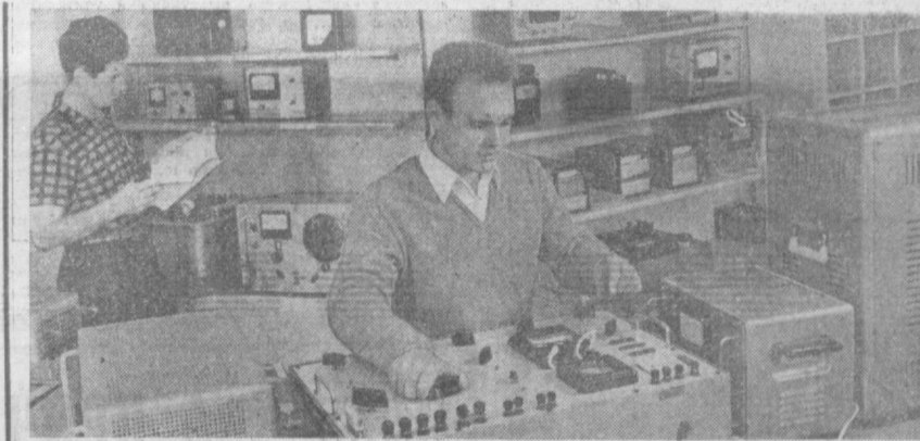
В Ташкенте несколько салонов «Приборы». Один из них расположен на массиве Актепе. В этом году ему исполнилось пять лет. НА СНИМКЕ: в зале салона «Приборы».

Строительство клуба тракторосборщиков намечено завершить к концу будущего года. Культурно-просветительное учреждение сооружается на средства предприятия. Для этой цели из заводского фонда выделяется 513 тысяч рублей.