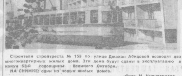
Строители строят № 153 по улице Динахан Абидовой возводят два многоквартирных жилых дома. Эти дома будут сданы в эксплуатацию в начале 53-й годовщины Великого Октября. НА СНИМКЕ: один из новых жилых домов.