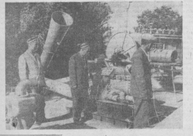
НА ВДНХ УССР в отделе орошения и механизации сельского хозяйства экспонируется новая техника, применяемая для орошения земель Каршинской степи и в Сырдарьинской области. НА СНИМКЕ: посетители знакомятся с техникой.

ПАРИЖ. Арабский язык станет с 1974 года пятым рабочим языком ЮНЕСКО (Организации Объединенных Наций по вопросам просвещения, науки и культуры). Решение об этом было принято на проходящей в Париже XVI-й сессии генеральной конференции ЮНЕСКО. В настоящее время рабочими языками этой организации являются английский, французский, русский и испанский. За признание арабского языка рабочим языком ЮНЕСКО проголосовали Советский Союз, социалистические страны, а также все развивающиеся государства.