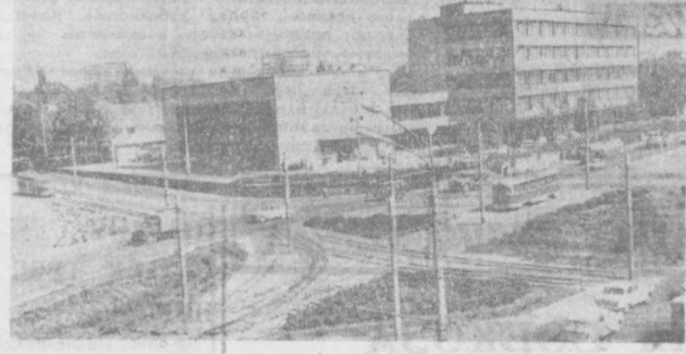
ТАШКЕНТ СЕГОДНЯ. НА СНИМКЕ: Дом моделей на Саперной площади.