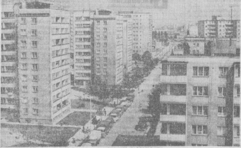
ПОЛЬСКАЯ НАРОДНАЯ РЕСПУБЛИКА. 50 лет назад Гдыня была небольшим рыбацким поселком. Сейчас Гдыня — крупнейший промышленный центр и морской порт. Здесь строятся крупнейшие суды различного назначения. Вместе с развитием промышленности преобразился и город. Выросли новые кварталы современных жилых домов, построены культурные и научные учреждения.