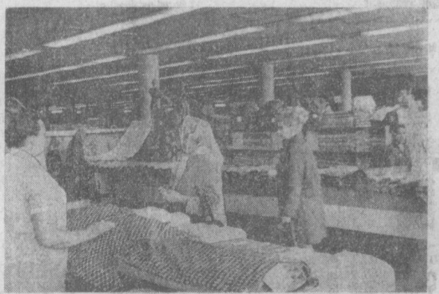
Многолюдно в эти дни в ЦУМе. Здесь идет предпраздничная торговля. НА СНИМКЕ: в отделе тканей.