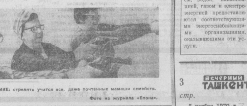
НА СНИМКЕ: стрелять участвт все, даже почтенные мамыи семейства.

некоторые виды птиц. Скашивается трава. Университет в Новой Скотии пытается вывести новый вид травы, отпугивающей пернатых, а также разрабатывает метод искусственного покрытия широких площадей вокруг аэродромов. Но наряду с этим имеется и другой путь. Некоторые канадские ученые предлагают отойти к птицам как к естественному явлению природы. Изучать их маршруты и соответственно прокладывать курсы, более разумно рассчитывать время воздушных рейсов. Решительно отменить при неблагоприятной обстановке полеты, назавтра на коммерческие потери. Составлять прогнозы. Выпускать в воздух легкие разведывательные самолеты. Относиться к птицам так, как авиаторы сейчас относятся к бурям, туману или обледенению. Признать, что не один только человек имеет право на воздушное пространство.