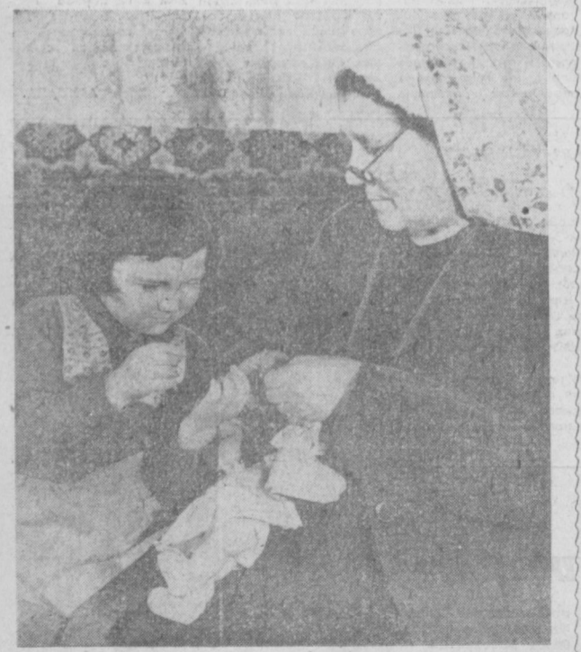
Бабушкины урони...