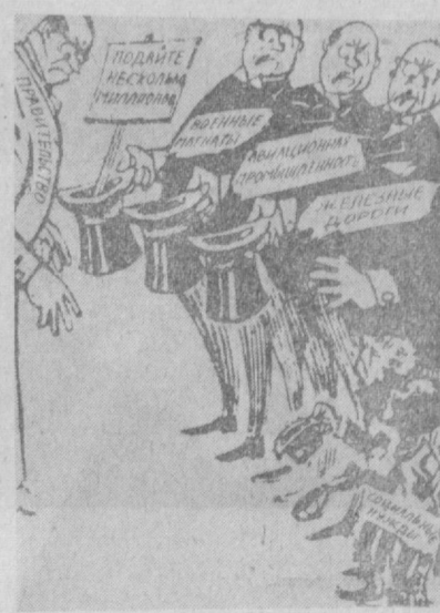
— А вам что нужно, несчастные попрошайки? Рисунок из американской газеты «Дейли уорлд».

Испания о репрессиях в стране, о единении демократических сил и других сторонах жизни и борьбы испанского народа. Участники собрания приняли резолюцию, в которой выражается солидарность со всеми прогрессивными силами Испании в их борьбе за демократию. В резолюции выражается также резкий протест против вышедшей в Бургосе судебной расправы над 16-ю патриотами-басками, шести из которых грозит смертная казнь.