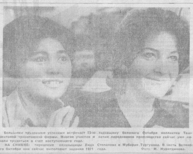
Большими трудовыми успехами встречает 53-ю годовщину Великого Октября коллектив Ташкентской трикотажной фабрики. Многие участки и сотни передовиков производства сейчас уже начали трудиться в счет наступающего года.

Советский машиностроитель и внешне должен выглядеть культурно.