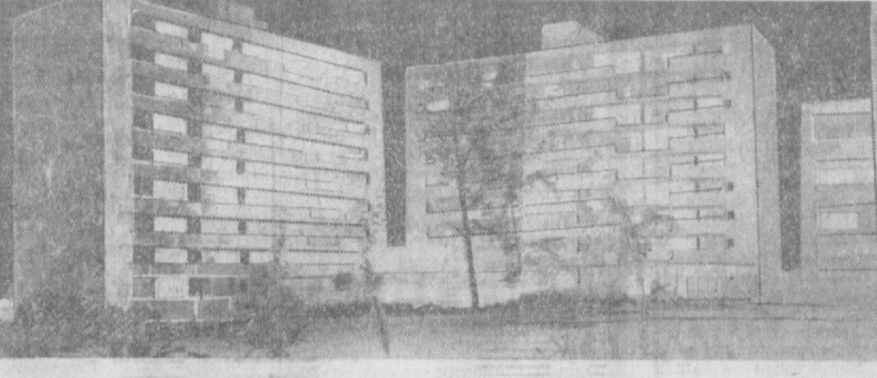
Ташкент вечерний. Дома в 23-м квартале Чиланзара.