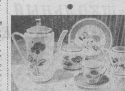
Днепропетровская область. Коллектив Синешиповского фарфорового завода, освоив простую технологию производства, систематически расширяет темпы выпуска продукции. В этом году рабочие решили изготовить дополнительно в плане 400 тысяч единиц посуды.

▲ ТАШКЕНТ. Новая продукция завода — кофейный сервис.