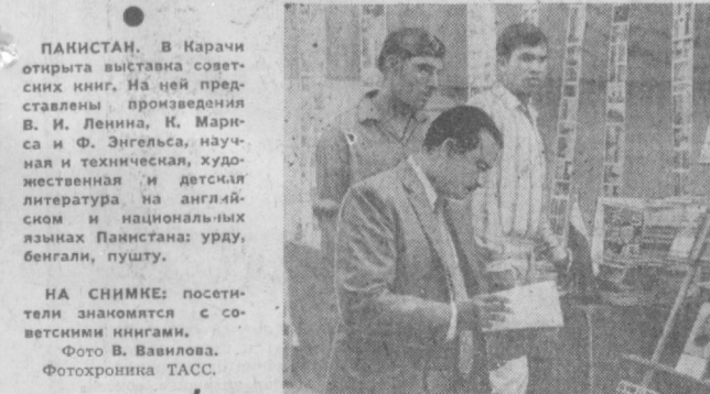
ПАКИСТАН. В Карачи открыта выставка советских книг. На ней представлены произведения В. И. Ленина, К. Маркса и Ф. Энгельса, научная и техническая, художественная и детская литература на английском и национальных языках Пакистана: урду, бенгали, пушту.

По проектам межреспубликанского филиала института Центросоюза начато строительство торговых комплексов в Орджоникидзевском и Калининском районах Ташкентской области и в Учкунганском районе Наманганской области. — Там же торговые