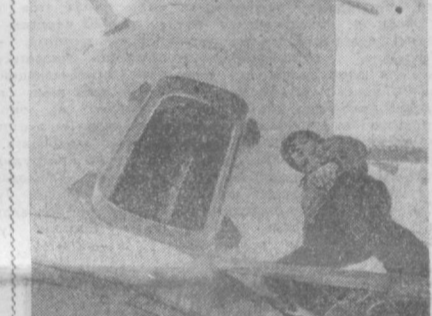
В Киеве сооружается новая башня телецентра. Ее высота пока лишь 42 метра, но вскоре она поднимется вверх на 372 метра. С помощью новой телебашни будет осуществляться передача трех программ телевидения и ультракоротковолновое радиовещание. Дальность приема возрастает до 100 километров.