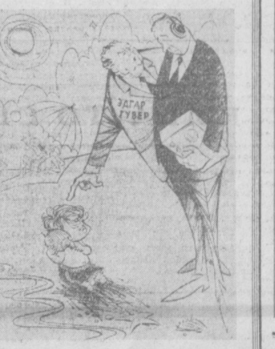
Директор ФБР Гувейр своему подчиненному: — Скорее послушайте эту связь... дело может касаться национальной безопасности. Рисунок из американской газеты «Ньюс-дей».

Федеральное бюро расследований организовало широкую сеть шпионажа за американцами. (Из газет.)