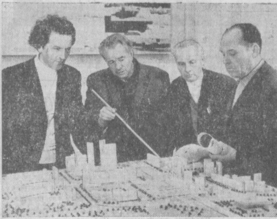
КИЕВ. Строительство микрорайона Левобережный ведется по проекту, созданному специалистами института «Киевпроект». Сейчас здесь разрабатывают проект общественно-торгового центра этого микрорайона.

Президиум Верховного Совета СССР присвоил звание Героя Социалистического Труда группе конструкторов и рабочих и наградил орденами и медалями СССР большое количество работников, наиболее отличившихся при создании и запуске автоматической космической станции «Луна-16». Постановлением ЦК КПСС и Совета Министров СССР присуждены Ленинская премия и две Государственные премии СССР в области науки и техники ученым, конструкторам, инженерам и рабочим за создание ракетно-космического комплекса, осуществление полета автоматической космической станции «Луна-16» и доставку лунного грунта на Землю.