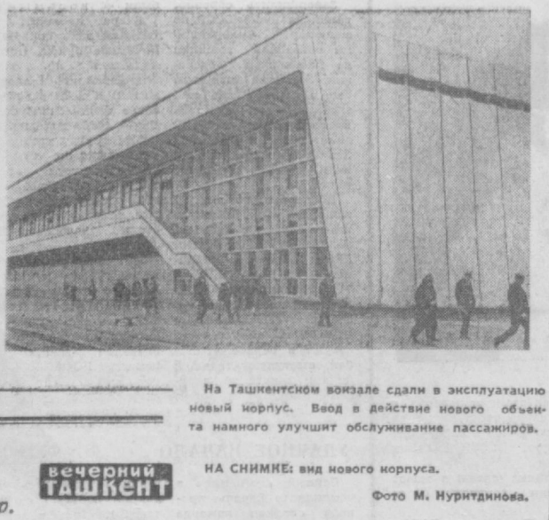
На Ташкентском вокзале сдали в эксплуатацию новый корпус. Ввод в действие нового объекта намного улучшит обслуживание пассажиров.

С. ВОЛОВЕЦ, соб. корр. АПН. Гага. (По телефону).