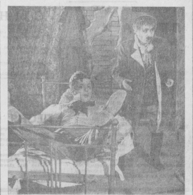
НА СНИМКЕ: СЦЕНА ИЗ СПЕКТАКЛЯ «РЕВИЗОР». ХЛЕСТАКОВ — НАРОДНЫЙ АРТИСТ СССР Н. РАХИМОВ, ОСИП — НАРОДНЫЙ АРТИСТ УЗССР Ш. КАЮМОВ.

Э ТОТ музей еще очень молод. Ему столько же, сколько и новому зданию театра имени Хамзы. В фотографиях и документах здесь собрана вся история развития театра, его достижения. У самого входа — большой портрет Хамзы Хамид-заде Навоий. 1920 год. Первые актеры, первые роли и афиши, написанные еще арабским шрифтом. Ш. КАРИМОВА. По поручению коллектива — секретаря партийной организации театра имени Хамиды Алимджана, заслуженный артист Узбекской ССР Баю ТАДЖИЕВ, председатель местного, Народной артистка Узбекской ССР Кыяфат МУСЛИМОВА. НА СНИМКЕ: СЦЕНА ИЗ СПЕКТАКЛЯ «РЕВИЗОР». ХЛЕСТАКОВ — НАРОДНЫЙ АРТИСТ СССР Н. РАХИМОВ, ОСИП — НАРОДНЫЙ АРТИСТ УЗССР Ш. КАЮМОВ.