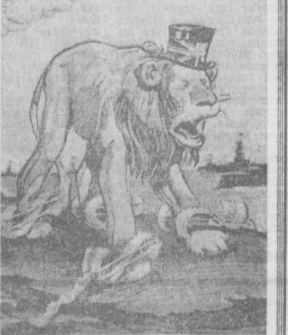
В долларовой кандалах. Рисунок из немецкого журнала «Ольшигель».

Монополии США контролируют десятки процентов английской промышленности. (Из газет).