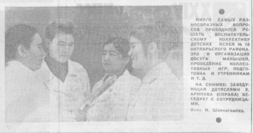
МНОГО САМЫХ РАЗНОСВЯЗНЫХ ВОПРОСОВ ПРИХОДИТСЯ РЕШАТЬ ВОСПИТАТЕЛЬНОМУ КОЛЛЕКТИВУ ДЕТСКОГО ЯСЛЯ № 18 ОКТЯБРЬСКОГО РАЙОНА. ЭТО И ОРГАНИЗАЦИЯ ДОСУГА МАЛЫШЕЙ, ПРОВЕДЕНИЕ КОЛЛЕКТИВНЫХ ИГР, ПОДГОТОВКА К УТРЕННИКАМ И Т. Д.

Неблагополучно на предприятии обстоит дело и с расходованием денежных средств. Произведенная в августе ревизия показала вскрытый ряд нарушений финансовой дисциплины. Так, за период с 1 сентября