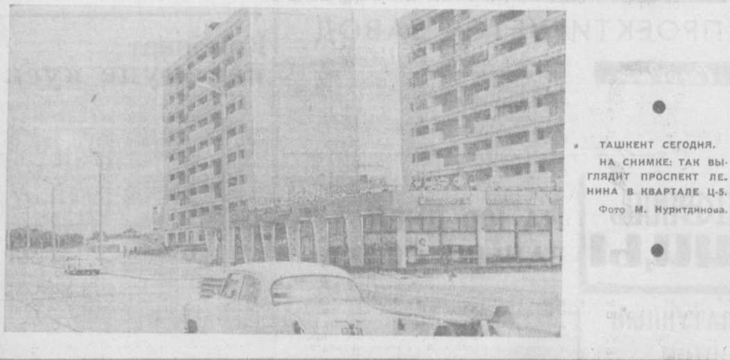
ТАШКЕНТ СЕГОДНЯ. НА СНИМКЕ: ТАК ВЫГЛЯДИТ ПРОСПЕКТ ЛЕНИНА В КВАРТАЛЕ Ц-5.