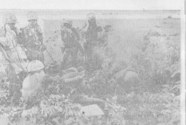
Соединенные Штаты, стремясь проводить в Юго-Восточной Азии политику «защиты против азиатского» и пытаясь придать агрессии в Индонезии видимость колониальной акции, аннулируют войну в азиатских странах. На протяжении ряда лет США выплачивали Таиланду ежегодно 50 миллионов долларов за то, что таиландские власти направляли в Южный Вьетнам дивизию. И сейчас Таиланд готовит и посылает в Южный Вьетнам, Лаос и Камбоджу своих солдат для пополнения поредевших рядов «исследовательского корпуса». В ряде таиландских провинций созданы специальные лагеря, где солдаты проходят ускоренную подготовку перед отправкой на фронт.

растет КОПЕНГАГЕН. На 40 процентов увеличилось в этом году по сравнению с предыдущими годами число тяжких уголовных преступлений в Дании. Об этом сообщила газета «Берлингскетиденде». В интервью, данном корреспонденту газеты, начальник государственной полиции Дании отметил, что речь идет о таких серьезных преступлениях, как кража со взломом, ограбление банков и торговля наркотиками. Преступность растет, несмотря на постоянное увеличение численности полицейского корпуса.