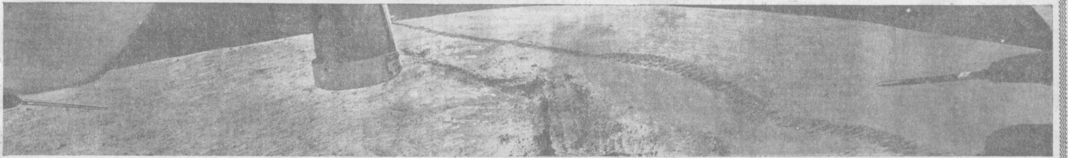
Этот снимок сделан 17 ноября вечером во время проведения сеанса связи с автоматическим самоходным аппаратом «Луноход-1». На снимке: лунная панорама и первая борозда, протеренная советским автоматом-вездеходом. Впечатление такое, что по рыхлой земле прошел трактор, оставив свой след.