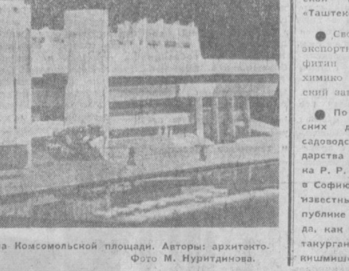
НА СНИМКЕ: макет будущей столовой-чайханы на Комсомольской площади. Авторы: архитекторы С. Пономарев, С. Сутгин и инженер В. Тен.

Борясь за достойную встречу XXIV съезда КПСС, труженики предприятия решили до конца 1970 года выпустить для нужд благоустройства города еще 1.100 кубометров изделий.