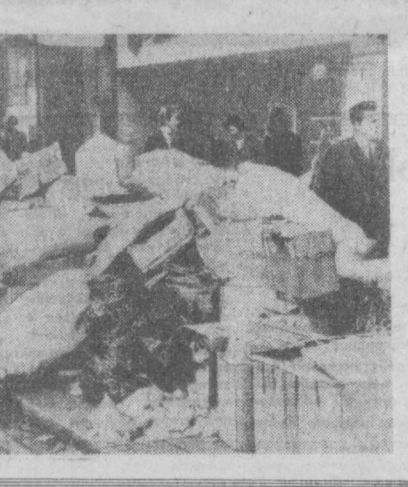
НА СНИМКЕ: на одной из столичных улиц.

Британских островов находится в руках американского капитала. Киноделцы из США уже не удовлетворяют здешнюю норму кинопроизводства. В результате одна за другой закрываются киностудии в Англии, тысячи работников кино остаются без работы.