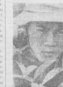
Южноветнамские патриоты продолжают наносить чувствительные удары по американско-саigonским войскам на территории всей страны. На СНИМКЕ: дозор НВСО в провинции Куангнам.