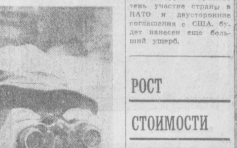
Южноветнамские патриоты продолжают наносить чувствительные удары по американско-саigonским войскам на территории всей страны. На СНИМКЕ: дозор НВСО в провинции Куангнам.