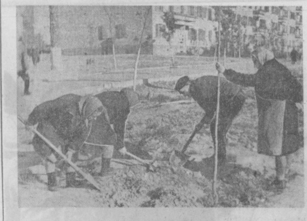
Рабочие-озеленители Ленинского райкомхоза производят осеннюю посадку декоративных деревьев по улице Лахути.

Речь Генерального секретаря ЦК КПСС товарища Л. И. Брежнев «Пятьдесят лет Советской Армении» на торжественном заседании ЦК Компартии Армении и Верховного Совета Армянской ССР.