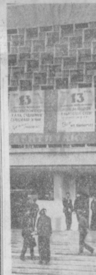
В агитпункте при Доме знаний всегда многолюдно. Здесь проводится большая агитмассовая работа с избирателями в связи с предстоящими выборами в народные суды.