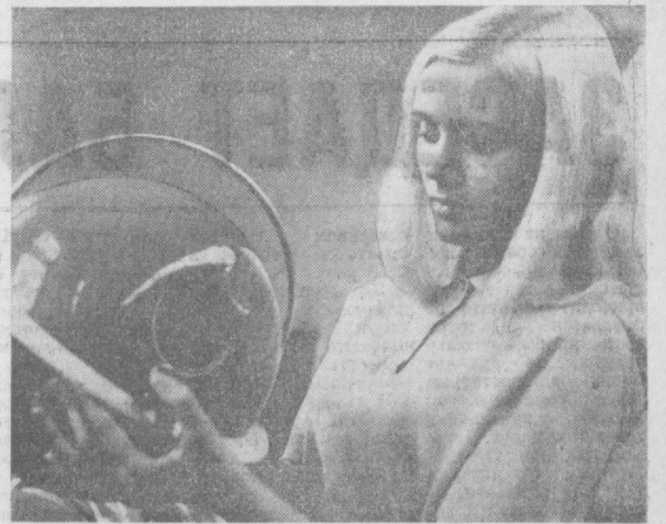
ЛИТОВСКАЯ ССР. С начала пятилетия Вилнинский завод электросварочного оборудования увеличил выпуск пылесосов «Сатурнас» более чем в 3 раза.

● 3 декабря в Ташкенте состоялся пленум ЦК ЛКСМ Узбекистана. Он обсудил работу комсомольских организаций молодого города Назои и совхоза имени Худайбердыева Чустского района Наманганской области по достойной встрече XXIV съезда КПСС.