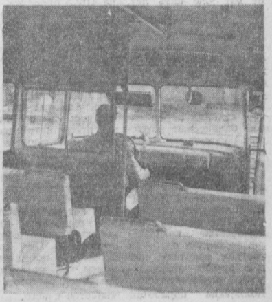
НА СНИМКЕ: вид пассажирского салона автобуса «КАВЗ-685».

Курганский автобусный завод готовится к серийному выпуску машин марки «КАВЗ-685», обладающих высокой проходимостью. Новая модель имеет комфортабельный салон для пассажиров, здесь созданы хорошие условия для работы водителя. Опытные образцы «КАВЗ-685» успешно прошли государственные испытания и утверждены для серийного производства — в 1971 году. Новый автобус предназначен для перевозки пассажиров в сельских населенных пунктах Урала, Сибири и Крайнего Севера.