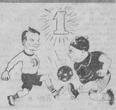
«в тени» и поехали на привычную для них спортивную в Самарканде, где проведет последние репетиции. Армейцы выбрали для подготовки Ташкент, где они уже опробовали место завтрашнего сражения. Первого декабря москвичи провели товарищеский матч с «Пактакором». Хозяева стадиона вышли в ослабленном составе. Армейцы сумели добиться перевеса только во втором тайме, когда Полжарко, Ду-

Команды по-разному готовились к «матчу года». Динамовцы предпочли оставаться пока