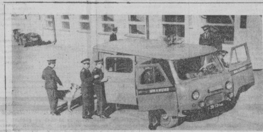
Следственная группа дежурного по городу выезжает на место происшествия.

В свое время один видный юрист сказал: «Чтобы правильно вести следствие, нужно овладеть наукой и техникой этого трудного и сложного дела. Работники следственного отдела УВД Ташгорисполкома стараются полностью овладеть этой наукой».