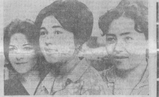
Достойными трудовыми подвигами готовятся встретить XXIV съезд КПСС коллектив трикотажной фабрики. Сотни работниц ныне трудятся в счет 1971 года.

Хамзинский район организован сравнительно недавно, в годы этой пятилетки. Но он стал одним из крупнейших районов города по объему промышленной продукции.