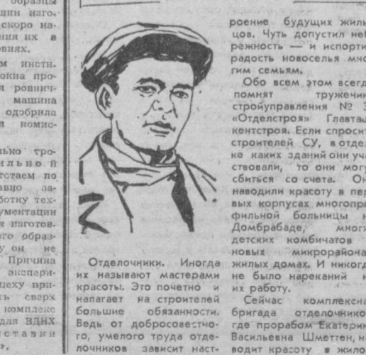
Худ. Н. Меламед.

Одделочники. Иногда их называют мастерами красоты. Это почетно и налагает на строителей большие обязанности. Ведь от добросовестного, умелого труда одделочников зависит настроение будущих жильцов. Чуть допустить небрежность — и испортил радость новоселья многим семьям. Обо всем этом всегда помнят труженники стройуправления № 31 «Отделстрой» Главташкентстрой. Если спросить строителей СУ, в отделе каких зданий они участвовали, то они могут сбиться со счета. Они ввели красоту первых корпусов многоэтажных домов на Дембараде, многих детских комбинатов, новых микрорайонах, жилых домах. И никогда не было нареканий на их работу. Сейчас комплексная бригада одделочников, где прораб Екатерина Васильевна Шметен, наводит красоту в жилом