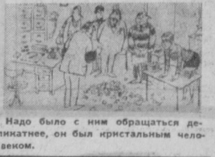
Надо было с ним обращаться деликатнее, он был кристальным человеком.