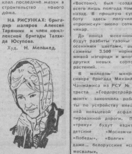
Худ. Н. Меламед.

Микросквер, который разбит по улице 8-го Марта (около кинотеатра «Восток»), был создан всего лишь полгодом тому назад. В прошлую субботу здесь получили «привкус» около сотни чинары. До конца месяца будут разбиты газоны с осенними цветами, высажены 3.500 норной жимолости и много других новых сортов растений. В молодом микросквере бригады маляров Чанжамиса из РСУ № 3 треста «Гордотстрой» закончили работы по устройству внешней кольцевой асфальтированной дороги. По тротуару будут ездить детские «Мосвичи», «Лобеды», «Волги» и даже белорусские «самосвалы».