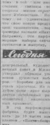
Худ. Н. Меламед.

В герб нашей республики вплетены белоснежные корочки хлопчатника. С «белым золотом» в той или иной степени связаны все стороны жизни социалистического Узбекистана. Поэтому не удивительно, что свою новую продукцию выставляет «Пакт» фабрика. Эти парфюмерные наборы сейчас готовятся к выпуску. В год парфюмерная фабрика будет выпускать до 10 тысяч комплектов «Пакт-баирама».