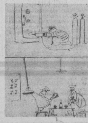
Представляю себе его лицо, когда он проснется.