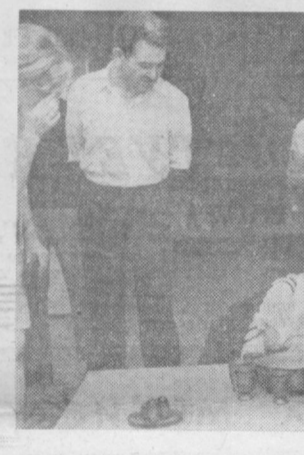
Фотоснимок выставки «Прикладное искусство России» в Нью-Дели.

ДЕЛИ. В индийской столице открыта выставка «Прикладное искусство России» Федерации. Среди экспонатов этой выставки, проводимой по программе культурного обмена между Советским Союзом и Индией, широко представлены резьба по дереву и кости, ювелирные изделия, живопись, керамика, кружева, игрушки. НА СНИМКЕ: посетители осматривают экспонаты.