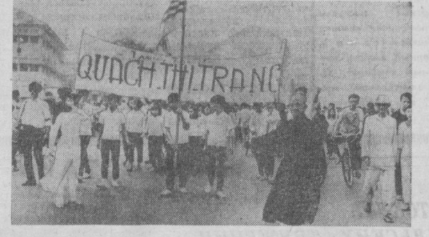
Где бы ни были американские военные базы — в Японии, на Филиппинах, Таиланде, — повсюду они вызывают гневный протест и возмущение населения. Даже в Сайгоне, этом «прифронтовом городе», где никогда практически не отменяется коммандантский час, население города устраивает антиамериканские демонстрации. Рабочие, студенты, школьники, буддистские монахи снова и снова выходят с лозунгами: «Мы хотим друзей мира, но не военных баз!», «Мы хотим независимости!», «Долой американцев!».

НА СНИМКЕ: антиамериканская демонстрация в Сайгоне. На транспаранте имя сайгонской студентки, убитой американской военной полицией.