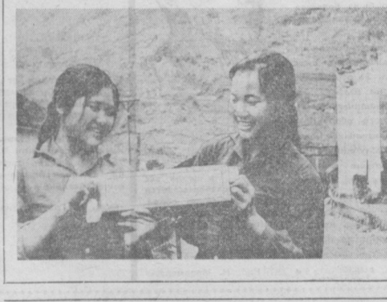
Оловянный рудник в Тинтенге в провинции Каобанг на севере Демократической Республики Вьетнам является одним из важнейших предприятий страны. Это открытый карьер, где рабочий процесс непрерывен — от добычи сырья до получения оловянных заготовок. Более 50 процентов рабочих — женщины. Коллектив предприятия награжден орденом Труда III степени. НА СНИМКЕ: в руках у работниц рудника оловянные заготовки, которые экспортируются в основном в социалистические страны.

мень. 5.000 жителей Крайовы переехали в этом году в новые квартиры. Новоселья празднуют в эти дни и в других городах страны. Всего за истекшую пятилетку в Румынии построено 323.000 квартир.