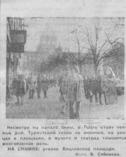
Несмотря на начало зимы, в Праге стоит теплые дни. Туристский сезон не окончен, на улицах и площадях, в музеях и театрах слышится многоголосная речь. НА СНИМКЕ: уголок Вацлавской площади.

Сообщают корреспонденты ТАСС, АПН и «Вечернего Ташкента»