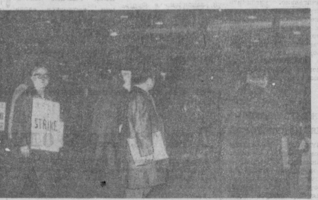
Вечером десятого декабря у железнодорожных вокзалов в Соединенных Штатах Америки появились пикеты забастовщиков. Крупнейший в стране профсоюз железнодорожников США и работников авиалиний, объединяющий около 300.000 человек, начал забастовку. Стачка пикетчиков объявлена в поддержку требований о повышении заработной платы и улучшении условий труда. НА СНИМКЕ: пикетчики у Пенсильванского вокзала в Нью-Йорке.

ОТТАВА. Премьер-министр Канады П. Трудо выразил беспредельно в связи с намерением правительства Англии возобновить продажу оружия расистскому режиму Южно-Африканской Республики. Выступая здесь на пресс-конференции, Трудо заявил, что такой шаг английского правительства представляет «весьма серьезную угрозу» всему содружеству наций. «Возможно, самую серьезную за его историю». Трудо выразил намерение продолжать переговоры с руководителями английского правительства и с главами других государств — членом содружества с тем, чтобы прийти к соглашению о недопустимости новых поставок оружия режиму ЮАР.