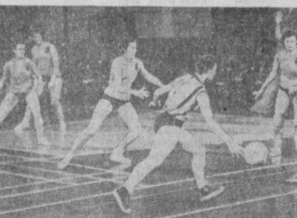
НА СНИМКЕ: ищут баскетболистки ташкентской «Мехната» (они в полосатых футболках) и команды Тартусского университета.

Специальности подсчитали, что такое решение проблемы наиболее эффективно и позволит сэкономить на строительстве водохранилища 70 миллионов, адекватных в озере будет достаточно.