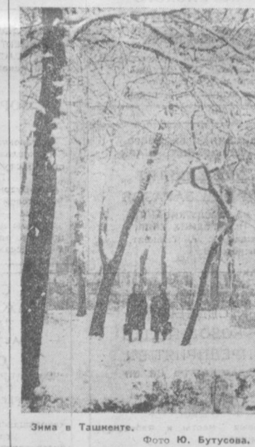
Зима в Ташкенте.