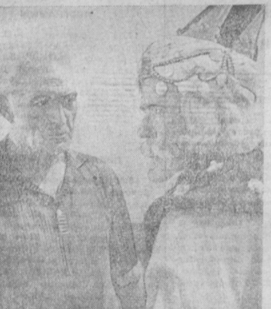
РЕЖИССЕРА КАМИЛА ЯРМАНОВА по праву называют ПАТРИАРХОМ узбекского кинематографа. Он автор волнующих киноповестей «Алишер Навои», известной трилогии о становлении советской власти в Средней Азии — «Буря над Азией», «Всадники революции», «Конец черного консула». Им снят и ряд других запомнившихся зрителю лент.