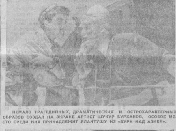
НЕМАЛО ТРАГЕДИЙНЫХ, ДРАМАТИЧЕСКИХ И ОСТРОХАРАКТЕРНЫХ ОБРАЗОВ СОЗДАЛ НА ЭКРАНЕ АРТИСТ ШУНУР БУРХАНОВ, ОСОБЕЕ МЕСТО СРЕДИ НИХ ПРИНАДЛЕЖИТ ЯЛАНШУРУ ИЗ «БУРИ НАД АЗИЕЙ».