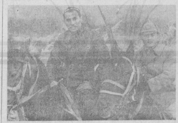
ВООБЩЕЕ ПРИЗНАНИЕ ПОЛУЧИЛА ПОСЛЕДНЯЯ РАБОТА ТАЛАНТЛИВОГО РЕЖИССЕРА А. ХАМРАЕВА «ЧРЕЗВЫЧАЙНЫЙ КОМИССАР» — ПРАВДИВЫЙ РАССКАЗ О СУРОВЫХ ГОДАХ СТАНОВЛЕНИЯ СОВЕТСКОЙ ВЛАСТИ В ТУРКЕСТАНЕ.