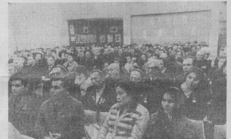
В зале заседаний Куйбышевской районной партийной конференции.

Однако, анализируя деятельность районной партийной организации в свете требований