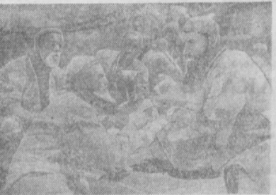
ВАЖНЫМ СОБЫТИЕМ в истории узбекского кино стал выход на экраны фильма «КЛЯТВА» (1937 год. РЕЖИССЕР А. УСОЛЬЦЕВ-ГАРФ).