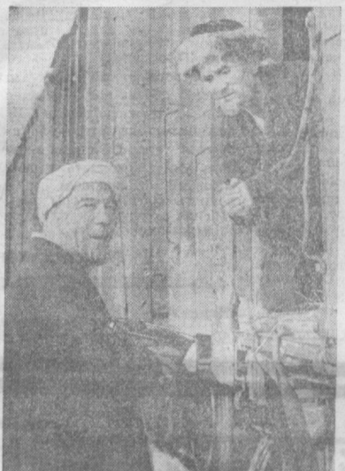
Подлинной человечностью проникнут фильм режиссера Р. БАТЫРОВА «ЛЮДИ СОРОК ПЕРВОГО ГОДА».

Таков девиз и у Ташкентской студии художественных фильмов. В последние годы творческий коллектив «Узбекфильма» немало порадовал зрителей. И они ждут от кинематографистов республики еще более значительных произведений, высокохудожественных, волнующих, достойных времени.