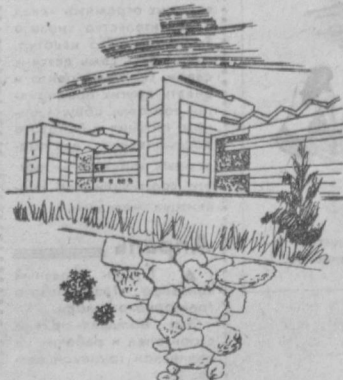
У филиала Центрального музея В. И. Ленина.