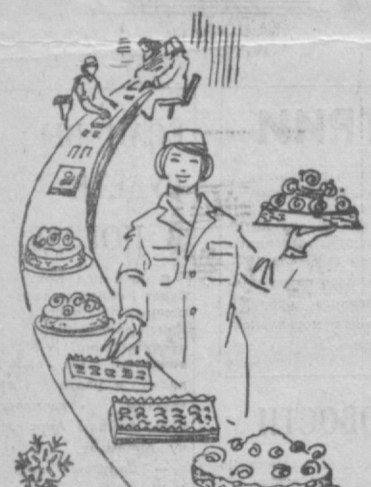
Кондитерская фабрика «Уртан».