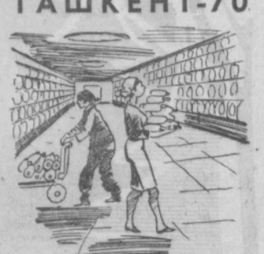
На предильной фабрике № 2 ордена Трудового Красного Знамени текстильного комбината.