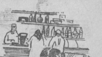
Рис. З. Лейтиской.