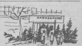
ИДЕТ БОЯКАЯ ТОРГОВЛЯ ЕЛКАМИ.