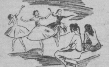
Во Дворце текстильщинов готовится чествования программа. Рис. З. Леваяской.