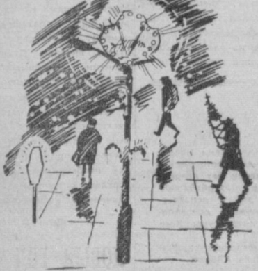
На улицах Ташкента.