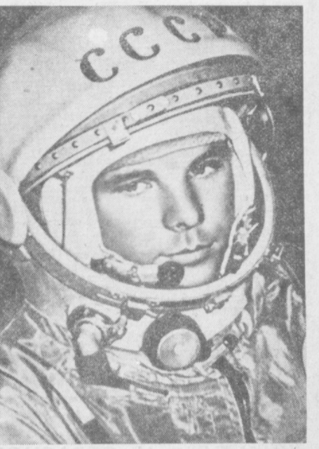
Летчик-космонавт СССР Юрий Алексеевич Гагарин перед полетом в космос, 1961 год.

Все большее применение при строительстве промышленных и производственных помещений получают пространственные металлические конструкции типа «Кислород». Уже построено несколько тысяч кубов роз, 400 фруктовых деревьев, 300 кустов винограда, полностью очищена ирригационная сеть. М. БАБАДИЖАНОВ.