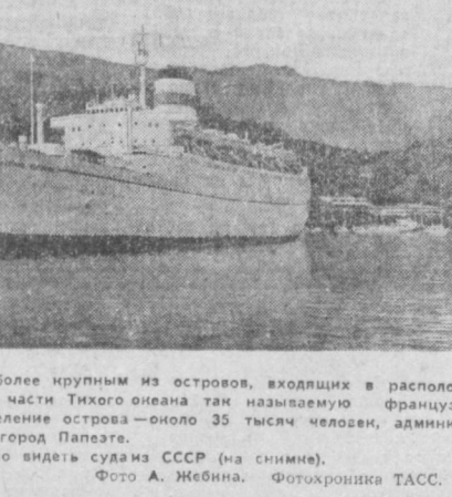
Таити является наиболее крупным из островов, входящих в республику Полинезия. Население острова — около 35 тысяч человек, административный центр — город Палеате. В порту часто можно видеть суда СССР (на снимке).

Превратившись в годы социалистического строительства в одно из самых крупных и современных предприятий ВНР, «Эдешюльт иззо» каждые пять лет увеличивает выпуск продукции почти в два раза. Сегодня рабочие завода направляют усилия на своевременное и качественное выполнение заказов к московской Олимпиаде.