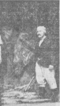
На снимке: сцена из спектакля.

Основоположник литературы социализма А. М. Горький неустойчиво отозвался за тесную связь литературы с жизнью, потому что не разрывал понятия писателя и «гражданина» и личным своим примером являл собой литератора — глашатай ленинской партийной повести, ответственного за все, чем живет, во что верит и за что борется партия и народ. Это служит для нас постоянным ориентиром.