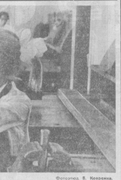
Фотоздод В. Ковренко.

Самое, самое... «Рыбки охотно рассказывают о том, как огромная рыба в последний момент сорвалась с крючка их удочки, но что насчет нас, то мы приводим официальные данные». Таким образом начинается вышедший недавно в Финляндии справочник, багательный: «Самые большие рыбы, пойманные в стране».