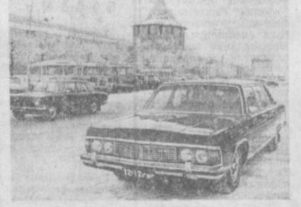
Новая модель легковой автомобиля «ГАЗ-14» «Чайка» (на снимке) запущена в производство на Горьковском автозаводе. От предыдущих образцов эта машина отличается не только обновленной внешней формой и оформлением салона. Она стала комфортабельнее. Усовершенствовано управление. Нет привоидной ручки переключения скорости. Автоматическая коробка передач во взаимодействии с электронной позволяет плавно трогать машину с места и быстро набирать нужную скорость. Двигатель «Чайки» имеет 220 лошадиных сил.