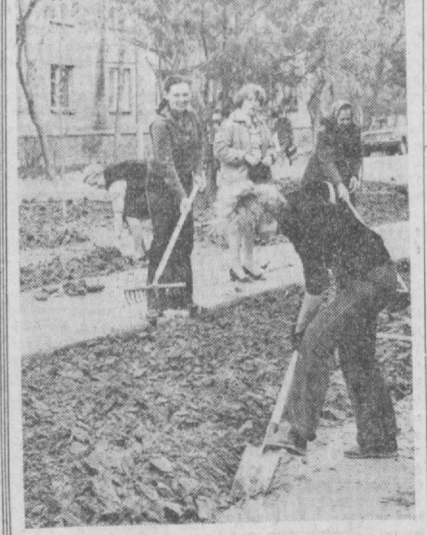
Активно участвует в благоустройстве Чиланзарского района коллектив треста «Специальторгстрой». С начала двухмесячного выполнения большого объема работ. Вокруг здания треста созданы цветники, разбиты газоны, илет посажены деревья и кустарников. Привлечены в порядок подъездные дороги — они отремонтированы, открыты заново асфальтом. НА СНИМКЕ: на очередном хашаре.

Труженики 120 организаций и предприятий Октябрьского района принимают участие в двухмесячном благоустройстве и озеленении. Уже высажено свыше 30 тысяч деревьев и 115 тысяч кустарников — столько, сколько намечалось высадить по плану. Создано пять микроскверов общей площадью 6,5 гектара: на проспекте 50-летия Узбекской ССР, набережной Анхоба, на площади Ахунбабаева, по улицам Хуршида и Бебули.