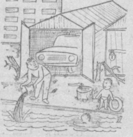
Б. МАСПЕННИКОВ. Рис. В. Дачкина.

За последние годы быстрыми темпами застраивается массив Карасу. Для жителей возводятся дома улучшенной планировки, со всеми удобствами. И очень плохо, что поблизости нет места отдыха.