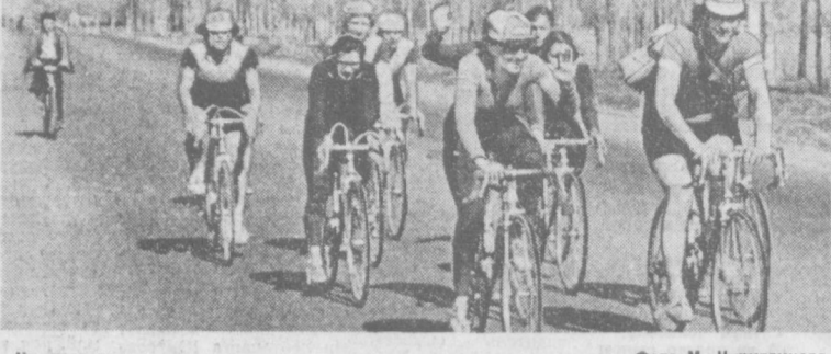
На прогулку...

И посоветовал мне, кататься на велосипеде.