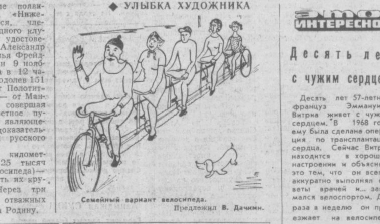
Семейный вариант велосипеда. Предложил В. Дачин.