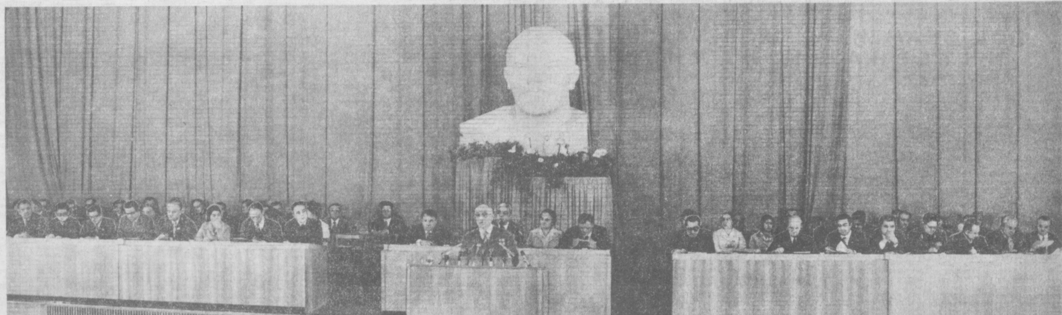
В зале заседаний внеочередной шестой сессии Верховного Совета Узбекской ССР девятого созыва.