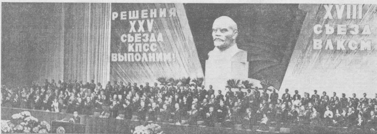
МОСКВА, 25 апреля. Кремлевский Дворец съездов. XVIII съезд ВЛКСМ. На снимке: во время открытия съезда.