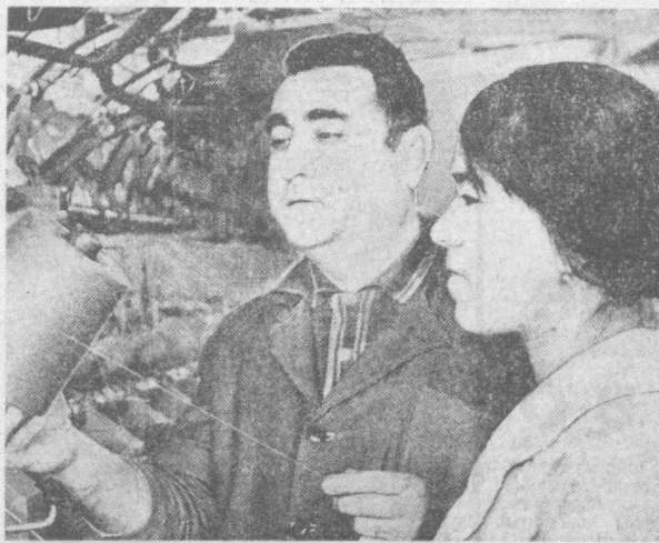
Все больше товаров народного потребления выпускает коллектив текстильно-галантерейного производственного объединения «Учун», который работает под девизом «Пятилетку досрочно».