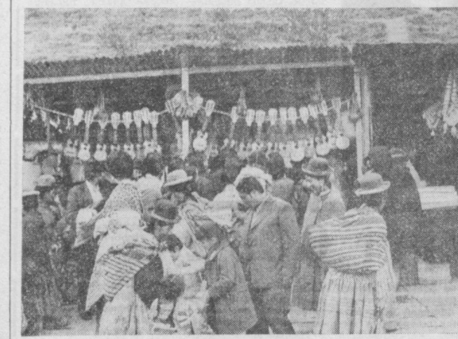
НА СНИМКЕ: традиционный ярмарка в Ла-Пасе.