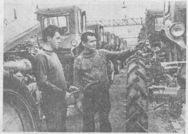
Ташкентский тракторный завод имени 50-летия СССР. Здесь выпускаются «стальные кони» хлопковых плантаций — тракторы марок «Т-28Х4» и «МТЗ-80Х». Только в четвертом году пятилетия их будет выпущено более 25,1 тысячи штук и направлено в хозяйства хлопководящих республик.

Немало еще других организационных новшеств, которые с успехом применяются на месте. Их состояние — железно, марганец, никель, кобальт и другие элементы — вымывались водой из кристаллического порока, переносились тужежнями и, наконец, оседали на морском дне. Такого заключения ученых-геологов, принимавших участие в только что завершившейся экспедиции в Индийский океан на боту научно-исследовательского судна Академии наук Украины «Академик Вернадский». Нынешний рейс, участие в котором, кроме украинских исследователей, приняли также ученые Москвы, Баку, Владивостока, можно отнести к одному из самых «урожайных». На борту подняты сотни килограммов порока, которые, по мнению исследователей, являются веществом мантии Земли, недоступным пока для науки на суше. На северо-восточном индийском подводном хребте найдены следы стигматийской кислоты. Интересно, что в этом же районе в конце прошлого века зарегистрирован эпицентр землетрясения. Не исключено, что этот шланг — «автограф» захороненного под водой вулкана. М. ТУРОВСКИЙ, В. ЧАМАРА, корп. ТАСС, Киев.