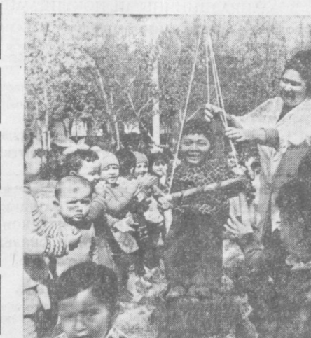
Дети — предмет особой заботы нашего государства, которое создает им все условия для всестороннего, гармоничного развития.

Ш. КАРИМОВ, старший преподаватель ТГПИИЯ им. Ф. Энгельса.