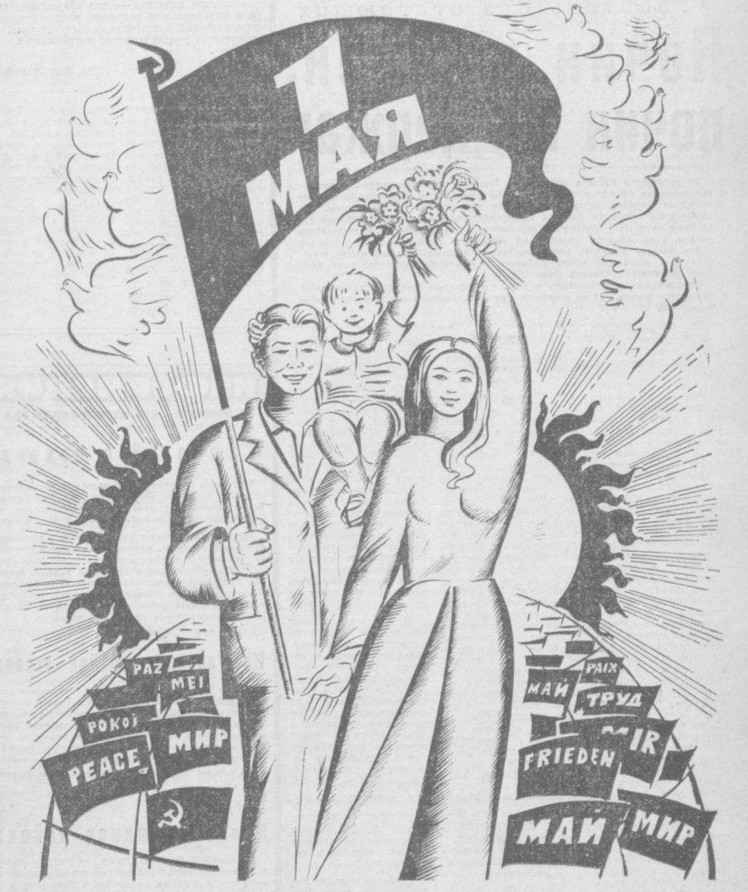
Рисунок А. Багдасаряна.

Узбекской ССР А. Р. Ходжаева. На собрании состоялось также награждение активистов гражданской обороны. области — обменялся опытом работы по пропаганде и внедрению в быт трудящихся новых обрядов и ритуалов, коммунистическому воспитанию молодежи, утверждению социалистического образа жизни, борьбе с пережитками прошлого. На конференции приняты рекомендации по дальнейшему совершенствованию этой работы.