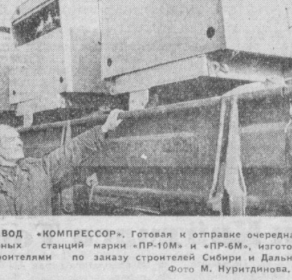
ТАШКЕНТСКИЙ ЗАВОД «КОМПРЕССОР». Готовая к отправке очередная партия компрессорных станций марки «ПР-10М» и «ПР-6М», изготовленных машинистами по заказу предприятий Сибири и Дальнего Востока.

Готовая к отправке очередная партия компрессорных станций марки «ПР-10М» и «ПР-6М», изготовленных машинистами по заказу предприятий Сибири и Дальнего Востока.