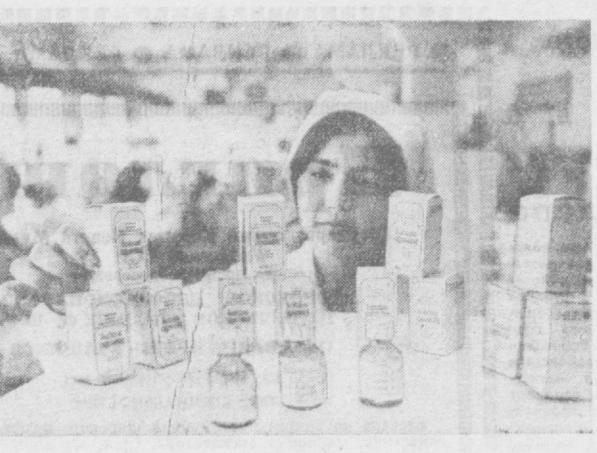
Выпуск анабазина гидрохлорида (на снимке) — средства для борьбы с курением — освоен на Ташкентском химико-фармацевтическом заводе.

В последние 30 — 40 лет во многих странах Европы, Азии и Америки наблюдается постоянный рост числа больных, страдающих раком легких. Заболевают главным образом мужчины. На 100 больших мужчин приходится 1