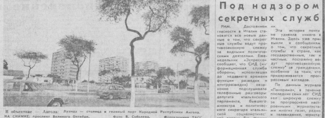
В объективе — Ангола: Луанда — столица и главный порт Народной Республики Ангола.