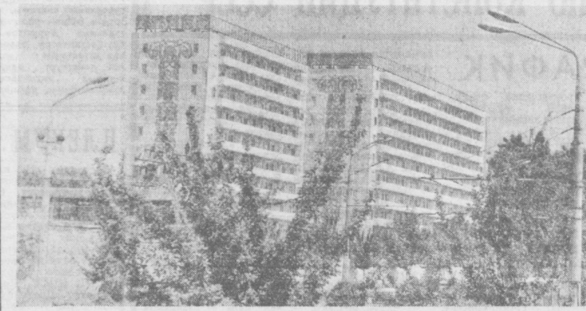
ТАШКЕНТ СЕГОДНЯ. На Лунарском шоссе выросли новые девятиэтажные жилые дома.

отдыхающих приняла турбаза «Романтика», расположенная в живописном уголке Адыгейской автономной области. Здесь открыт пока единственный на Северном Кавказе конно-спортивный маршрут, который привлекает гостей из многих городов страны. ЦХАЛТУБО (Грузинская ССР). Первые томаты продукции из урвала нынешнего года выпустила чайная фабрика. К открытию сезона на переработку сырья колхоза предприятия подготовились заранее. В нынешнем году чайная промышленность республики произведет свыше 100 тысяч тонн арматной продукции — на десять тысяч тонн больше, чем в прошлом сезоне. (ТАСС).