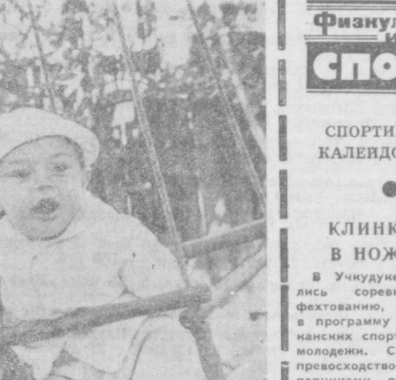
На начелях.